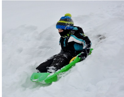
de la luge