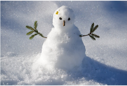
Un bonhomme de neige

On aime jouer dans la neige, faire des bonhommes de neige, de la luge et du ski.